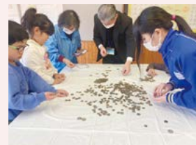
外国コインの仕分け