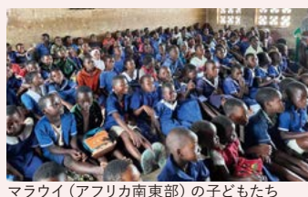
マラウイ(アフリカ南東部)の子どもたち

ユニセフ(UNICEF:国連児童基金)は、第2次世界大戦によって厳しい生活を強いられていた子どもたちへ緊急支援を行うために、1946年に創設されました。現在は世界約190の国と地域で、保健、栄養、水と衛生、教育、暴力や搾取からの保護、HIV/エイズ、緊急支援、政策提言などの支援活動を実施しています。1955年に「日本ユニセフ協会」が、さらにその地域組織として2010年に「茨城県ユニセフ協会」が設立されました。写真展などの広報活動や募金、学習会等を通じて、私たちの地域と世界のユニセフの活動が繋がっています。