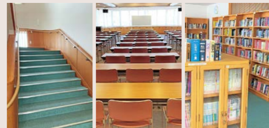
全館に手すりを設置 多目的ホール 情報コーナーには日本語教育の資料も多数

開館25周年を記念して、国際交流展示室とMITO国際ショナルライブラリーのリニューアルを予定しています。