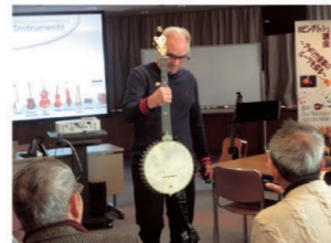
ホビングリッシュ講座