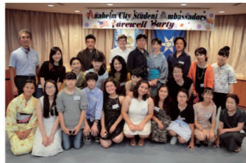
アナハイム市学生親善大使