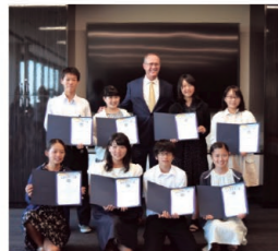
水戸市学生親善大使

アナハイム市から学生が来水し、市民宅へのホームステイや学校での授業参加等を通して日本文化への理解を深め、友好交流を行います。(6月22日から7月3日)