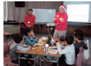
子どものための国際教育講座