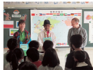
小学校への外国人講師派遣