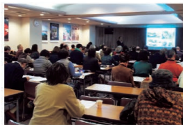
国際交流のつどい

市民の国際理解を深めるため、国際交流に関する講演会や料理教室等を開催します。(2月～3月)