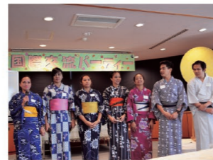
国際交流お月見パーティー

日本文化や様々な国の文化に触れあうことができるパーティーを、ボランティア団体とともに開催します。(10月、1月) (年2回)