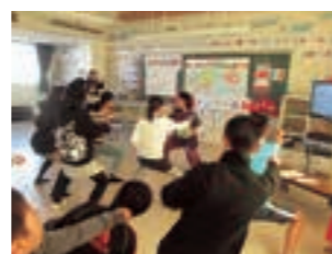
小学校への外国人講師派遣