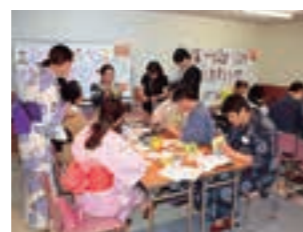
国際交流お月見パーティー

水戸市の英会話教育事業を支援し、国際理解及び国際交流を促すため、要望のあった市内の学校等に外国人を講師として派遣します。(随時)