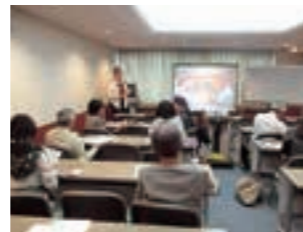
ホビングリッシュ講座