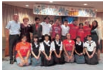
水戸・アナハイム両市の学生親善大使

アナハイム市から学生が来水し、市民宅へのホームステイや学校での授業参加等を通して日本文化への理解を深め、友好交流を行います。(6月24日から7月4日)