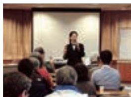
国際交流のつどい

「MITO国際ショナルライブラリー」開設1周年を記念し、国際交流に関する展示やイベント等を開催します。(2月～3月)