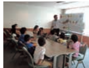
子どものための国際教育講座