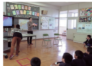
小学校への外国人講師派遣