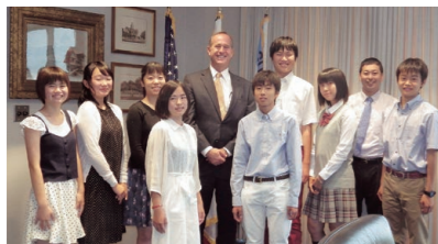
昨年度の 水戸市学生親善大使 (アナハイム市長と)

国際的視野に立つ人材を育成するため、7月24日から8月3日までの11日間、中学2年生から高校生までの8名の学生親善大使をアナハイム市へ派遣します。日本文化紹介やアメリカの授業体験・施設見学のほか、アナハイム市民宅にホームステイし交流を深めます。