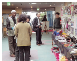
国際交流のつどい