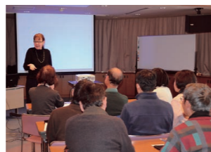
ホビングリッシュ講座

親子の国際講座……………(6月、12月) 青少年のための国際理解講座……………(7月～8月) 国際理解のつどい……………(11月) 世界の文化講座……………(6月、11月～12月、1月～2月) 世界の文化と芸術講座……………(1月～2月) 世界の料理講座……………(6月～7月、11月～12月、1～2月) ホビングリッシュ講座……………(6月、9月～10月、1月～2月) 子どものための国際教育講座……………(7月～9月) そのほかの国際理解講座……………(随時)