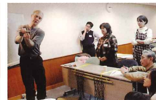
ホビングリッシュ講座