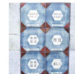
メモリアルプレート(陶板)

プレートサイズ：30cm×30cm 金額：一口5万円以上 詳しくは、事務局にお問合せください。