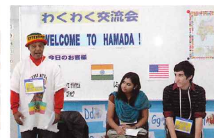
小学校への外国人講師派遣