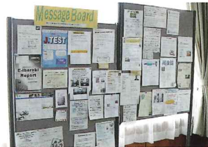
メッセージボード

語学交流や文化交流等、自由に情報交換ができるメッセージボードを2階ロビーに設置しています。このメッセージボードをとおして交流の輪を広げてみませんか?ご希望の方は、センター事務室に掲示したい物をお持ちください。