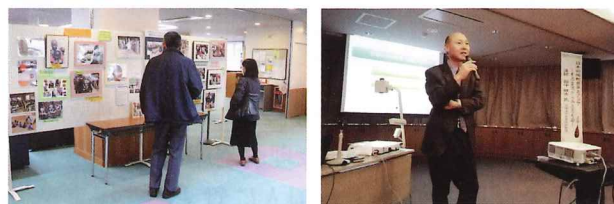
国際交流のつどい

国際交流ボランティア団体等の活動が円滑に行えるよう支援していきます。また、市民に対し、団体等の交流活動の紹介や講演会を通じ、国際理解を深めてもらうための啓発事業を行います。