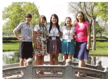
アナハイム市学生親善大使

市民間の交流、相互理解、友好親善を目的に、国際親善姉妹都市アナハイム市、友好交流都市重慶市との交流をさらに深めます。