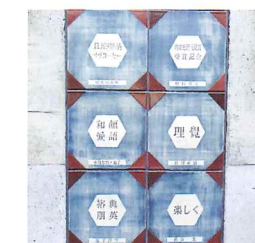
メモリアルプレート(陶板)