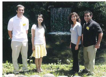
アナハイム市学生親善大使

市民間の交流、相互理解、友好親善を目的に、国際親善姉妹都市アナハイム市、友好交流都市重慶市との交流をさらに深めます。