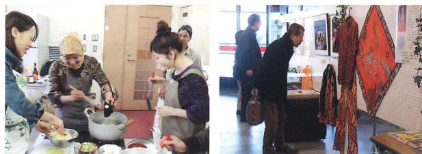
国際交流のつどい

国際交流ボランティア団体等の活動が円滑に行えるよう支援していきます。また、市民に対し、団体等の交流活動の紹介や講演会を通じ、国際理解を深めてもらうための啓発事業を行います。