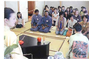
国際交流パーティー