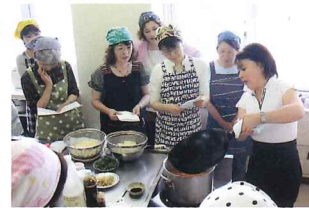
黄さんの料理講座