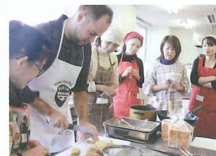
世界の文化と料理