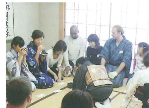
お月見パーティー