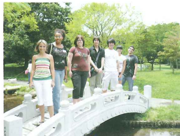
アナハイム市学生親善大使

市民間の交流、相互理解、友好親善を目的に、国際親善姉妹都市アナハイム市、友好交流都市重慶市との交流をさらに深めます。