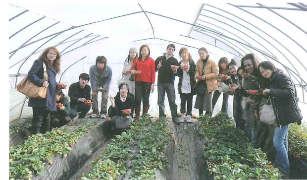
市内ウォッチング

市内在住外国人、留学生の方々に、水戸市や日本の文化を理解してもらうため、各種事業を行い、相互理解を深めます。