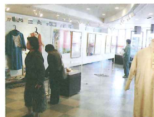
国際交流のつどい「魅惑のインド展」

国際交流ボランティア団体等の活動が円滑に行えるよう支援していきます。また、市民の皆さんに、団体等の交流活動の紹介や講演会を通じ、国際理解を深めてもらうための啓発事業を行います。