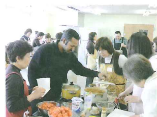
インドカレー講習会