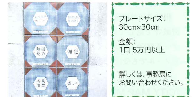
メモリアルプレート(陶板)