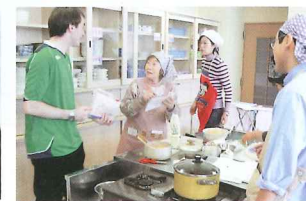
世界の文化と料理講座