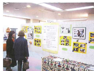
国際交流のつどい