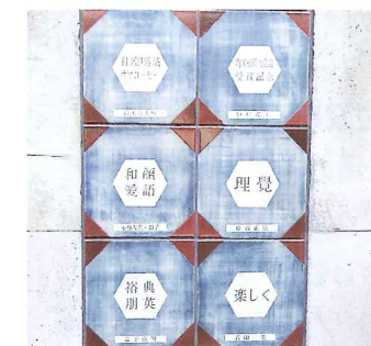
メモリアルプレート(陶板)