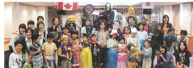
親と子の国際講座

市民に国際交流及び世界の文化などについて理解を深めてもらうため、各種の講座を行います。また、国際交流パーティーを開催し、市民と外国人との交流の場の創出に努めます。また、市内の学校や地域団体に国際理解のため、外国人を講師として派遣します。