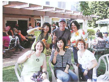
水戸市学生親善大使の派遣

市民間の交流、相互理解、友好親善を目的に、国際親善姉妹都市アナハイム市、友好交流都市重慶市との交流をさらに深めます。