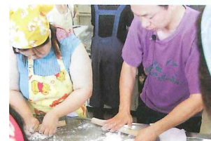
手作り餃子講習会