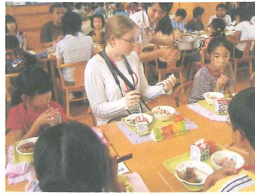
アナハイム市学生親善大使：稲荷第一小学校訪問

市民間の交流、相互理解、友好親善を目的に、国際親善姉妹都市アナハイム市、友好交流都市重慶市との交流をさらに深めます。重慶市との交流では、青少年相互交流事業を推進してまいります。