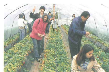
市内ウォッチング：いちご狩り

市内在住外国人、留学生に対し、水戸市や日本の文化の良さを理解してもらうため、各種事業を行い、相互理解を深めます。