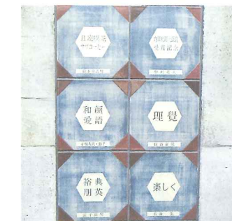
メモリアルプレート(陶板)