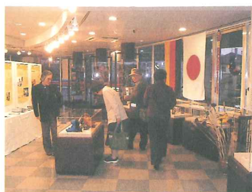
国際交流のつどい：ドイツポスター展

国際交流ボランティア団体等の活動が円滑に行えるよう支援していきます。また、市民に対し、団体等の交流活動の紹介や講演会を通じ、国際理解を深めてもらうための啓発事業を行います。