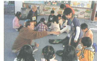
外国人紹介：浜田小学校