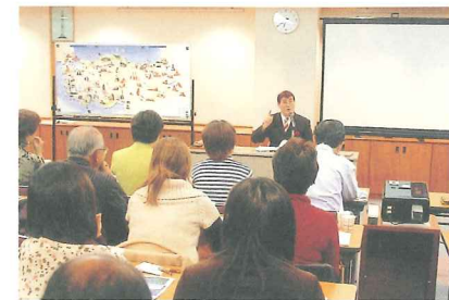
世界遺産講座(トルコ編)