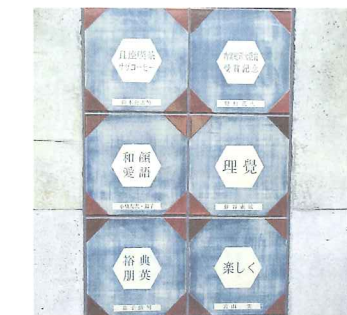
メモリアルプレート(陶板)