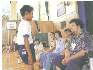
アナハイム市学生親善大使：学校訪問

市民間の交流、相互理解、友好親善を目的に、国際親善姉妹都市アナハイム市、友好交流都市重慶市との交流をさらに深めます。重慶市との交流では、青少年相互交流事業を推進してまいります。