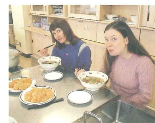
日本料理教室：お雑煮にチャレンジ!