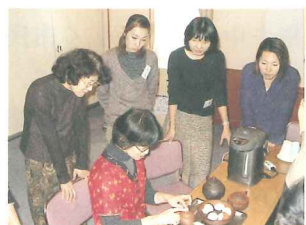
世界の文化と料理：台湾の茶藝体験

国際交流ボランティア団体等の活動が円滑に行えるよう支援していきます。また、市民に対し、団体等の交流活動の紹介や講演会を通じ、国際理解を深めてもらうための啓発事業を行います。