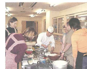
日本料理に興味津々!