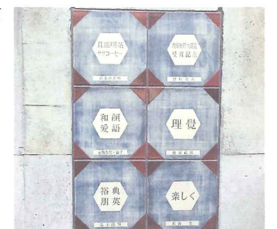
メモリアルプレート(陶板)