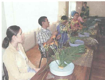
アナハイム市学生親善大使：生け花体験

市民間の交流、相互理解、友好親善を目的に、国際親善姉妹都市アナハイム市、友好交流都市重慶市との交流をさらに深めます。重慶市との交流では、青少年相互交流事業を推進してまいります。