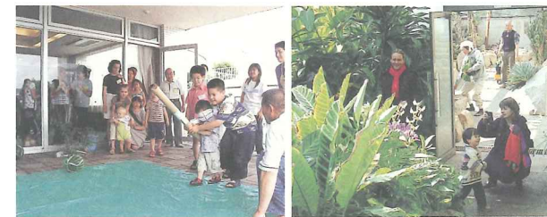
ボランティア団体：活動の様子 市内ウォッチング：水戸市植物公園にて

国際理解及び国際交流を促すため、要望のあった市内の小・中学校等に外国人を講師として派遣します。