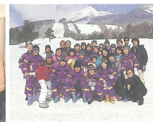
雪に喜ぶ留学生たち