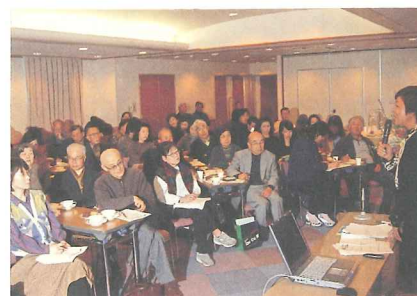
講演会「添乗員の泣き笑い〜実りある海外旅行のために〜」

国際交流ボランティア団体等の活動が円滑に行えるよう支援してまいります。また、市民に対し、団体等の交流活動の紹介や講演会を通じ、国際理解を深めてもらうための啓発事業を行います。