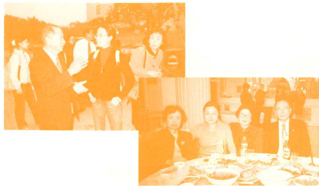
四川外国語学院日本語部の学生と

四川外国語学院で日本語を学ぶ学生さん達から直接話を聞いたり、校内を案内してもらいました。学生達はみんな勉強家で、朝6時に図書館へ行き、学校が終わった後は夜の12時頃まで勉強するとのことでした。正しい日本語で、情熱的に語る学生の姿に感動しました。また、学生達と一緒に歌いながら、国を超えて何かほのぼのとした温かい感情がこみあげ、言葉が通じ合うありがたさ、うれしさを実感したひとときでした。