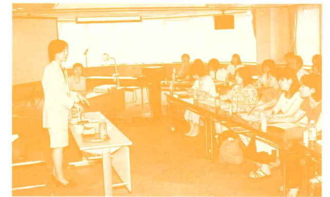
第1回MIJネットワーク研修会