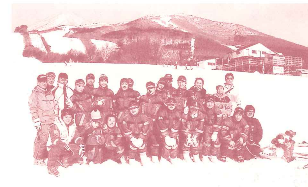
初めて雪に触れ楽しむ留学生

雪に触れたことがない外国人に、スキーをとおして日本の四季の良さを体験してもらうため実施します。