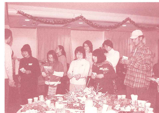
お月見をテーマに開催される国際交流パーティー

市民、ボランティア団体及び市内在住外国人で、互いの文化を紹介するパーティーを3回程度開催します。