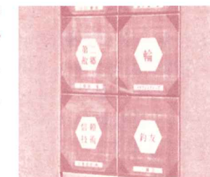
メモリアルプレート(陶板)

国際交流の掛け橋となるメモリアルプレート設置協賛者を募集して、基金の造成に努めます。