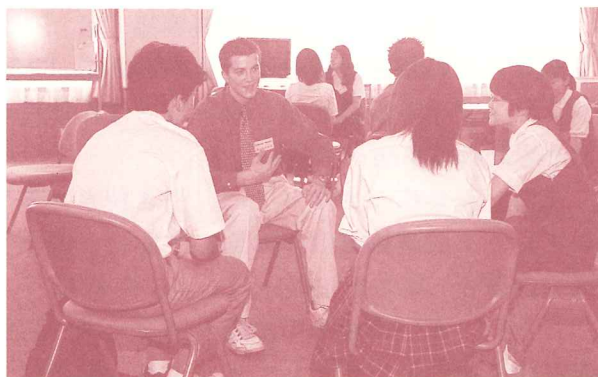
談話する水戸市とアナハイム市の学生親善大使

7月2日から16日まで、アナハイム市から6人の学生が来水し、市民宅へホームステイしながら水戸の生活を体験します。