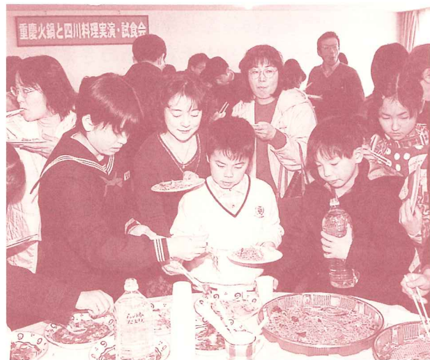
友好交流都市提携1周年を記念して行われた中国・重慶展と国際交流のつどい