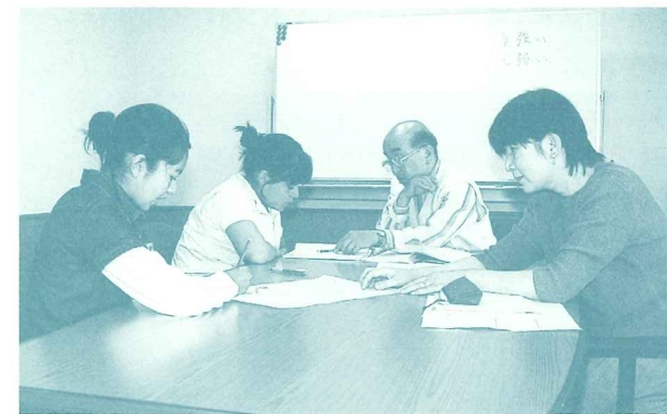
日本語の指導は、各学校への派遣だけでなく、国際交流センターでも行っています。

日本語が良く分からない市内在住外国人の子どもを対象に、ボランティアを学校へ派遣し、日本語を指導します。