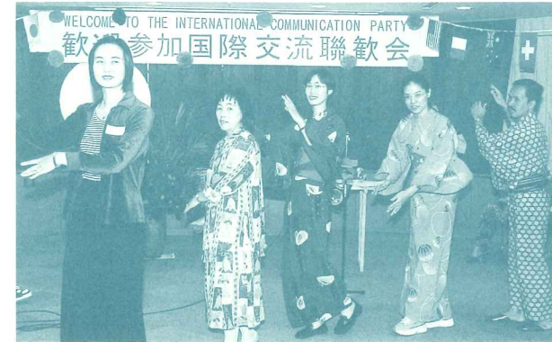
お月見をテーマに開催される国際交流パーティー

市民、ボランティア団体と市内在住外国人で、お月見やクリスマスなどをテーマに互いの文化を紹介するパーティーを3回程度開催します。