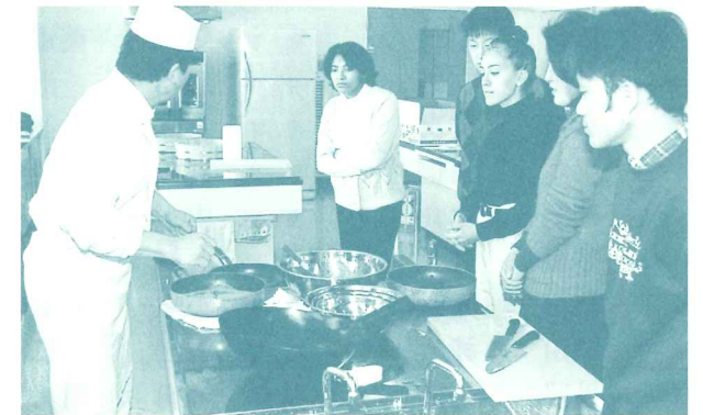
日本の家庭料理を学ぶ外国人の皆さん