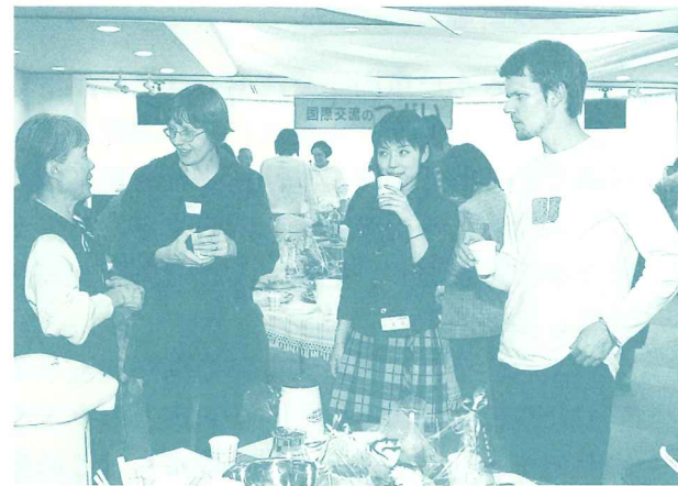
世界の食文化などをテーマに開催される国際交流のつどい

水戸市や交流団体などと共催して、国際交流団体等の紹介や講演会などを中心に開催します。