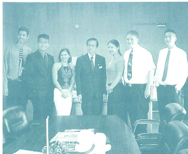
アナハイム市学生親善大使、市長への表敬訪問

7月初めの2週間、アナハイム市から5人の高校生が来水し、市民宅へホームステイをしながら水戸の生活を体験します。