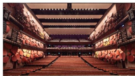
1F グロービスホール (大ホール)