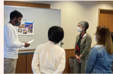
写真 日本語フシ初級クラス