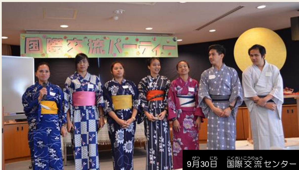
9月30日 国際交流センター