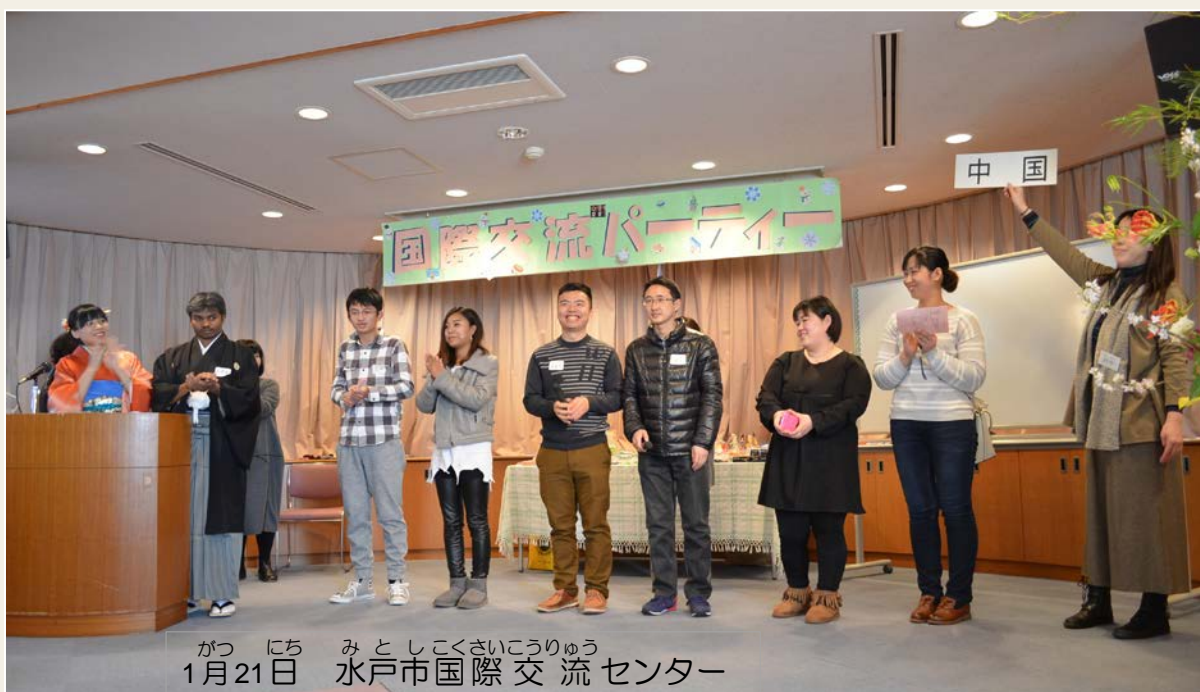
がつ にち みとしこくさいこうりゅう 1月21日 水戸市国際交流センター