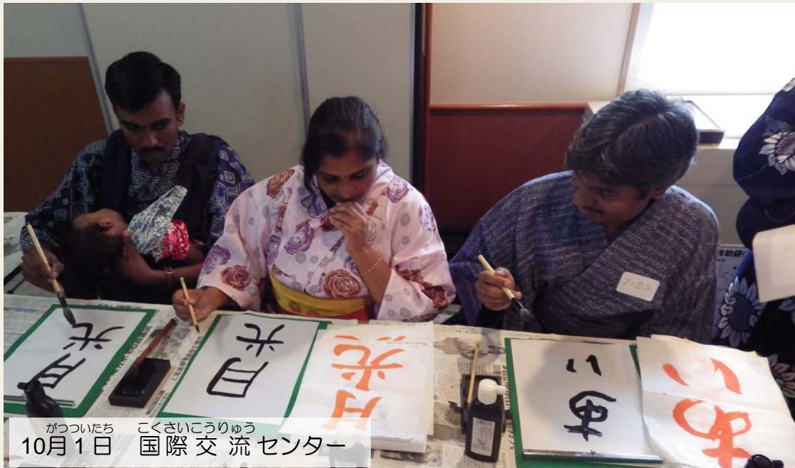
がつついたち 10月1日 こくさいこうりゅう 国際交流センター