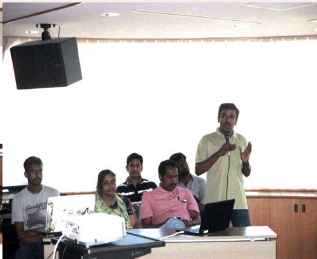
がつとうか 9月10日 みとしこくさいこうりゅうセンター