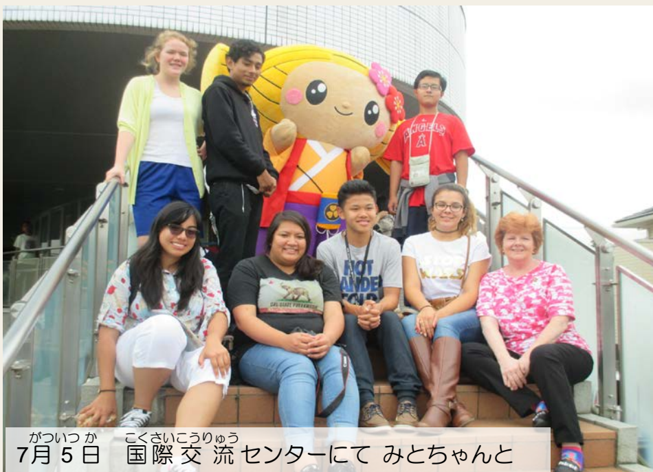
7月5日 国際交流センターにて みとちゃんと