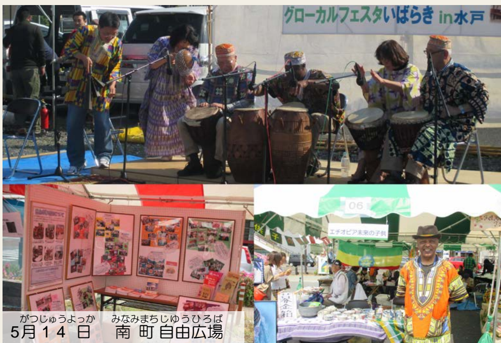
がつじゅうよっか 5月14日 みなみまちじゅうひろば 南町自由広場