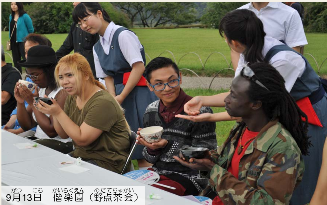
9月13日 偕楽園 (野点茶会)