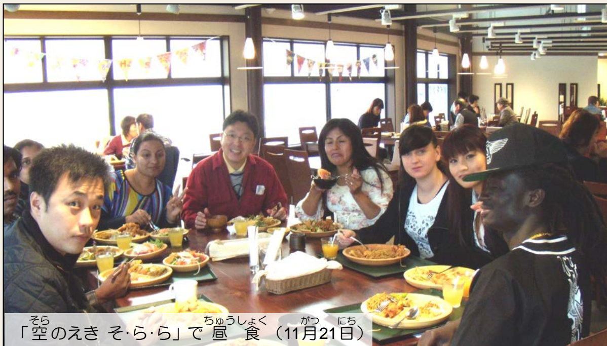
写真 いばらき発見ツアー